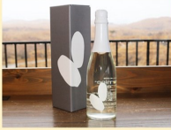
大嶺酒造 Ohmine 二粒 720ml 1本