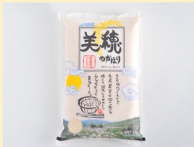
山口県農業協同組合 美穂のかほり 5kg 1袋