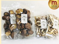
園田きこり農園 乾燥しいたけ 各2袋