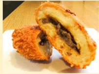
美祢観光開発(株) 美東ごぼうコロッケ(冷凍) 80g 10個