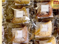
Cafe Brass スコーン6個