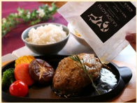
梶岡牧場 梶岡牛プレミアムハンバーグ 200g 5個