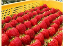
Agri charm (アグリチャーム) いちご 1箱(4パック入り)