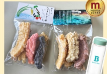
堅田地区まちづくり協議会 かきもち2袋・エコボトル1本