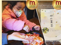
森の駅・あさぎり会 ピザ作り体験引換券(2人分) ・柿の葉茶 1袋