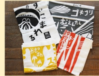
Mine秋吉台ジオパーク てぬぐい 2枚

このマークがついている景品は、Mine秋吉台ジオパークパートナーに認定された事業者の商品です。