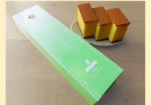
美祢観光開発(株) 秋芳の梨カステラ 1本