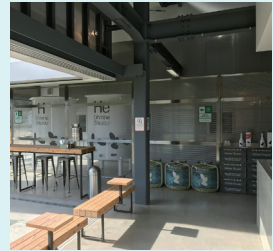
ノンアルコールメニューも豊富です