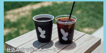
仕込み水で作ったコーヒー

田園風景の中に純白の建物がたたずむおしゃれ酒蔵カフェ。お酒が苦手な方にも嬉しいドリンクも各種あります。