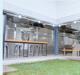
おしゃれな店内で席を選ぶのも楽しみの1つ