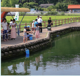
釣竿を借りてニジマスを狙おう