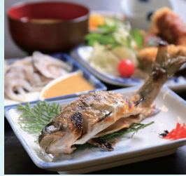
併設の「弁天会館」や「泉流庭」で調理してもらえる(有料)