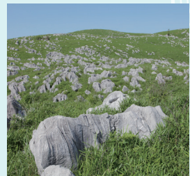
秋芳洞エレベーター口から秋吉台展望台まで約300m