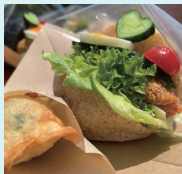
まずバーガーや湧水を使ったドリンクも楽しめる