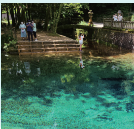
Benten Blue を背景に、人気の撮影スポットです