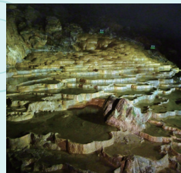
秋芳洞は秋吉台観光交流センターから約500m