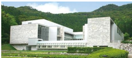
外観 (秋吉台国際芸術村)