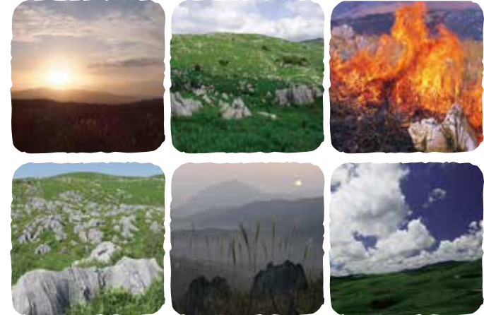
AKIYOSHIDAI / AKIYOSHIDO