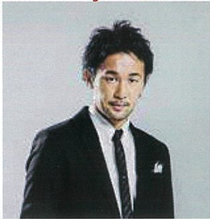
山中慎介 ボクシング